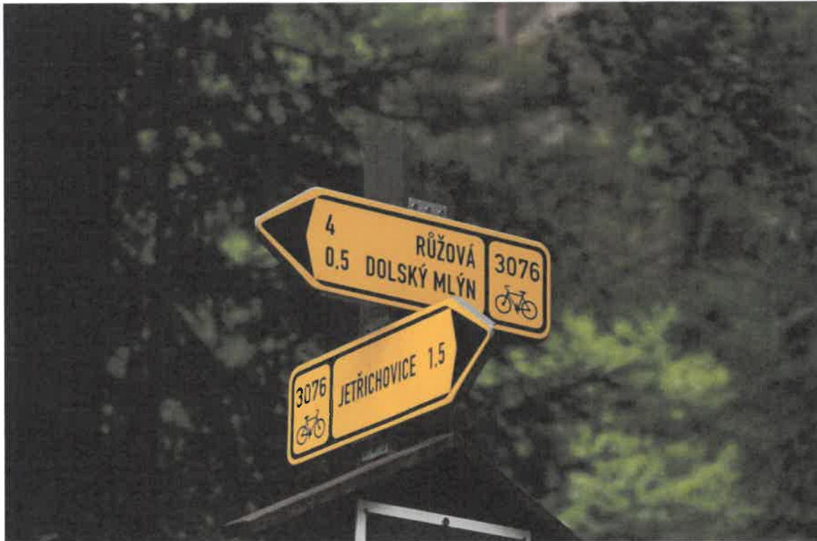
Obr. 2: Směrové cedule s označením cyklotras