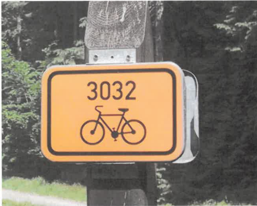
Obr. 1: Cedule – Označení cyklotrasy