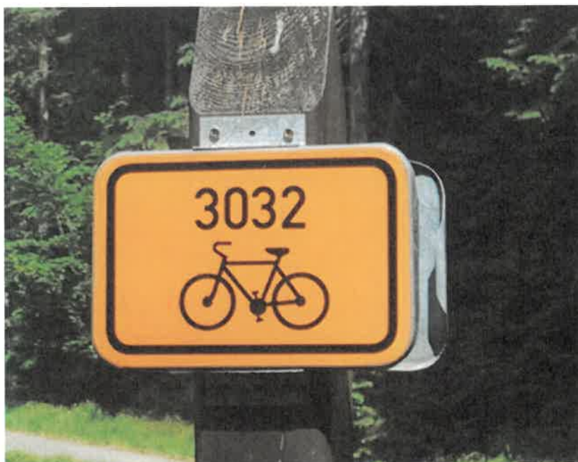
Obr. 1: Cedule – Označení cyklotrasy