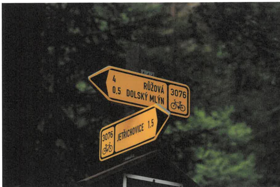
Obr. 2: Směrové cedule s označením cyklotras